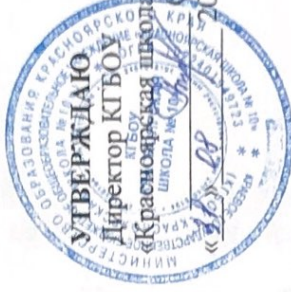
ГРАФИК РАБОТЫ БРАКЕРАЖНОЙ КОМИССИИ